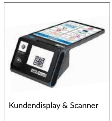
Kundendisplay & Scanner